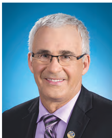
Ghislain Bolduc Député de Mégantic

5600, rue Frontenac - Bureau 201, Lac-Mégantic (Québec) G6B 1H5 Tél. : 819 583-4500 • Sans frais : 1 800 567-3523 Courriel : gbolduc-mega@assnat.qc.ca